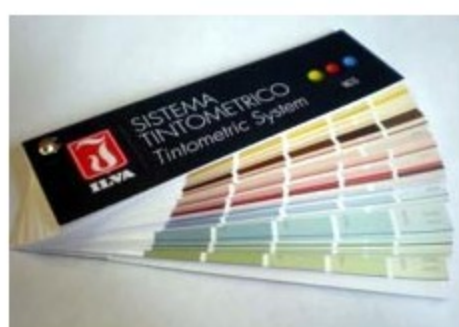
Carta de Colores NCS CASCADE 305

La Carta de Colores NCS Cascade 305 es una selección de colores extraída de la carta NCS standard, de la cual han sido seleccionados los colores más utilizados y difundidos en el sector del mueble y la decoración. Este instrumento representa una elección innovadora que simplifica el proceso de selección y reproducción del color deseado.